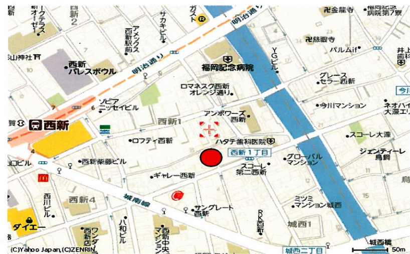
てんぐ屋西新ビル201号 77.88㎡/22.34坪